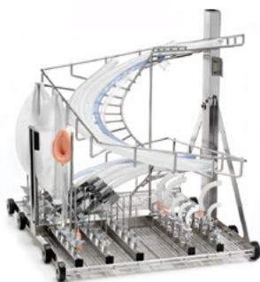
Mycie zestawów anestezjologicznych