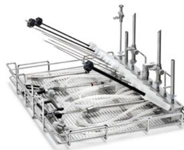
Mycie narzędzi do chirurgii małoinwazyjnej